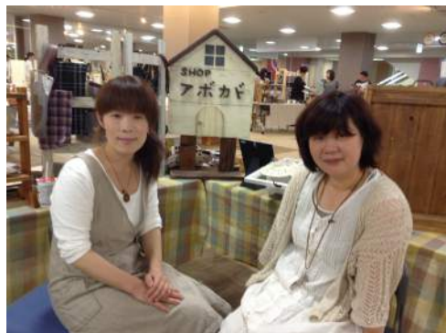
いつもニコニコ笑顔♪SHOPアボカドのお二人!

SHOPアボカドの作品は「布小物」「ヘアリボン」「レジンのネックレス」「携帯のストラップ」「キーホルダー」などなど! お問い合わせは下をみて!